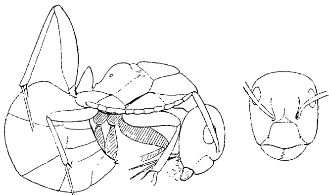
Fig. 2. Camponotus igneus ? Ouvrière pseudogyne. Grossissement 10 : 1.

2. — J'attribue avec doute à Camponotus igneus Mayr l'exemplaire dont ci-après la figure. Le doute dans la détermination est occasionné